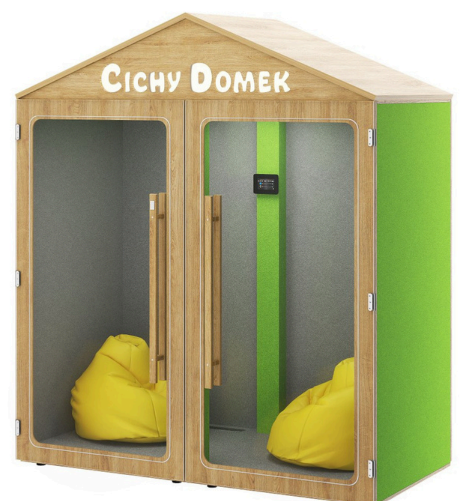
Opcja z pufami