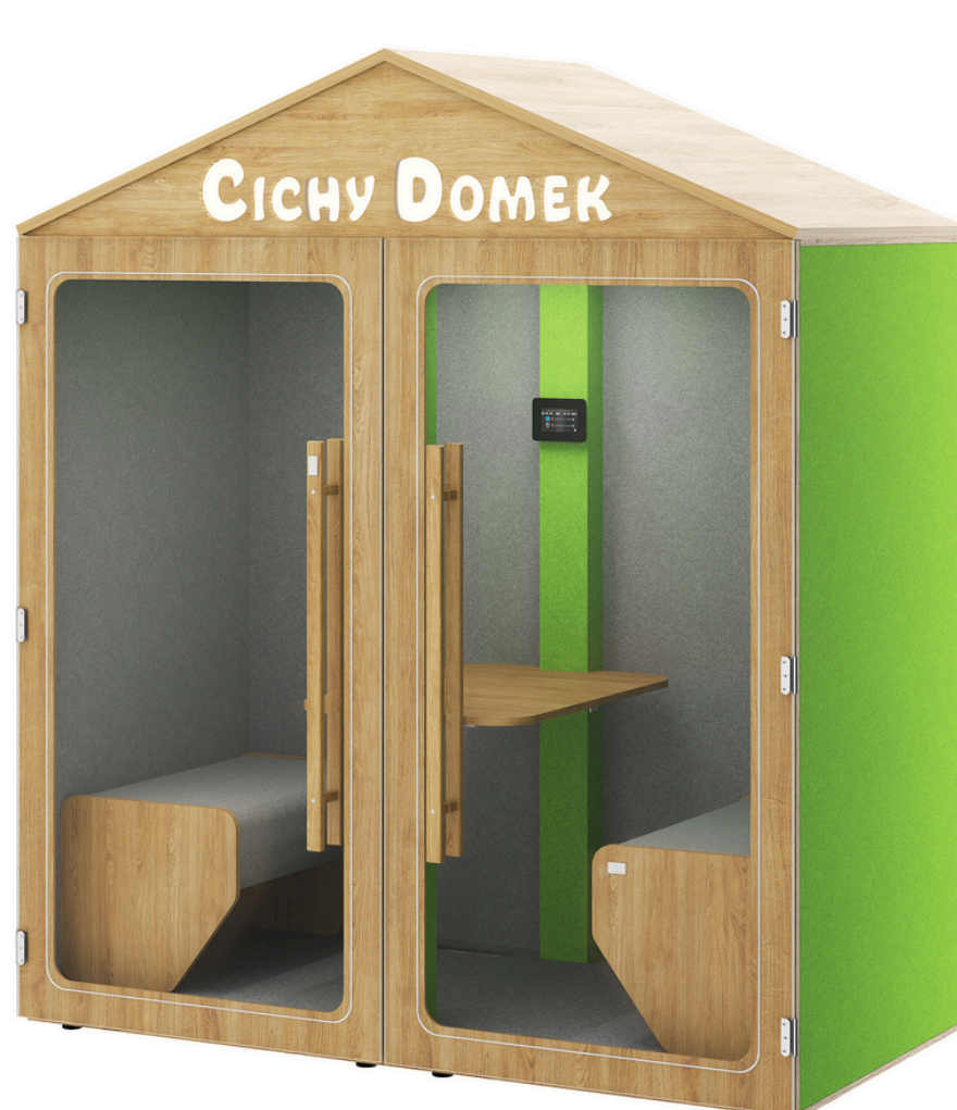
Opcja z pełnym wyposażeniem

Wychodząc naprzeciw powyższym potrzebom stworzyliśmy rozwiązanie dla szkół pod nazwą CICHY DOMEK . Jest to kabina akustyczna przeznaczona dla dzieci w wieku szkolnym. Domek pełni funkcję pokoju wyciszenia - pomaga przebodźcowanym dzieciom wyciszyć się i uspokoić w stresującej sytuacji lub po prostu znaleźć schronienie przed wszechobecnym hałasem. Mamy nadzieję, że kabina świetnie sprawdzi się również w przypadku dzieci z zaburzeniami ze spektrum autyzmu , zapewniając im poczucie fizycznego bezpieczeństwa.