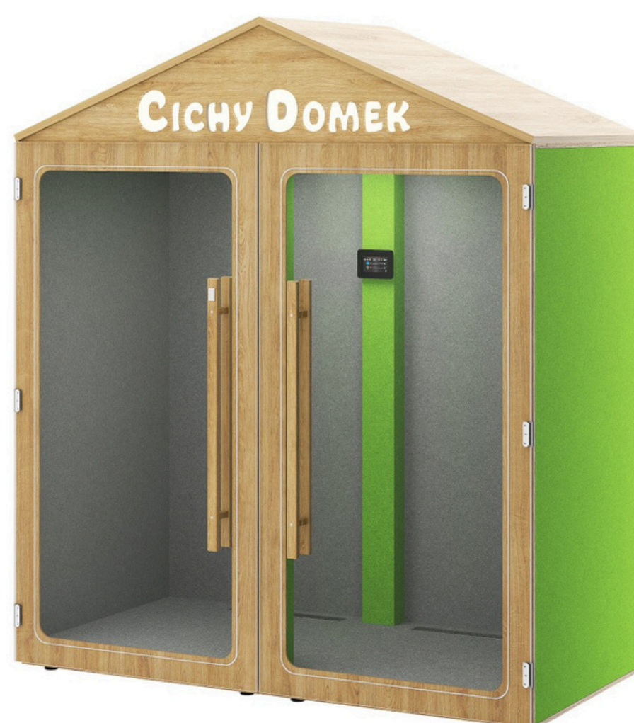
Opcja bez wyposażenia